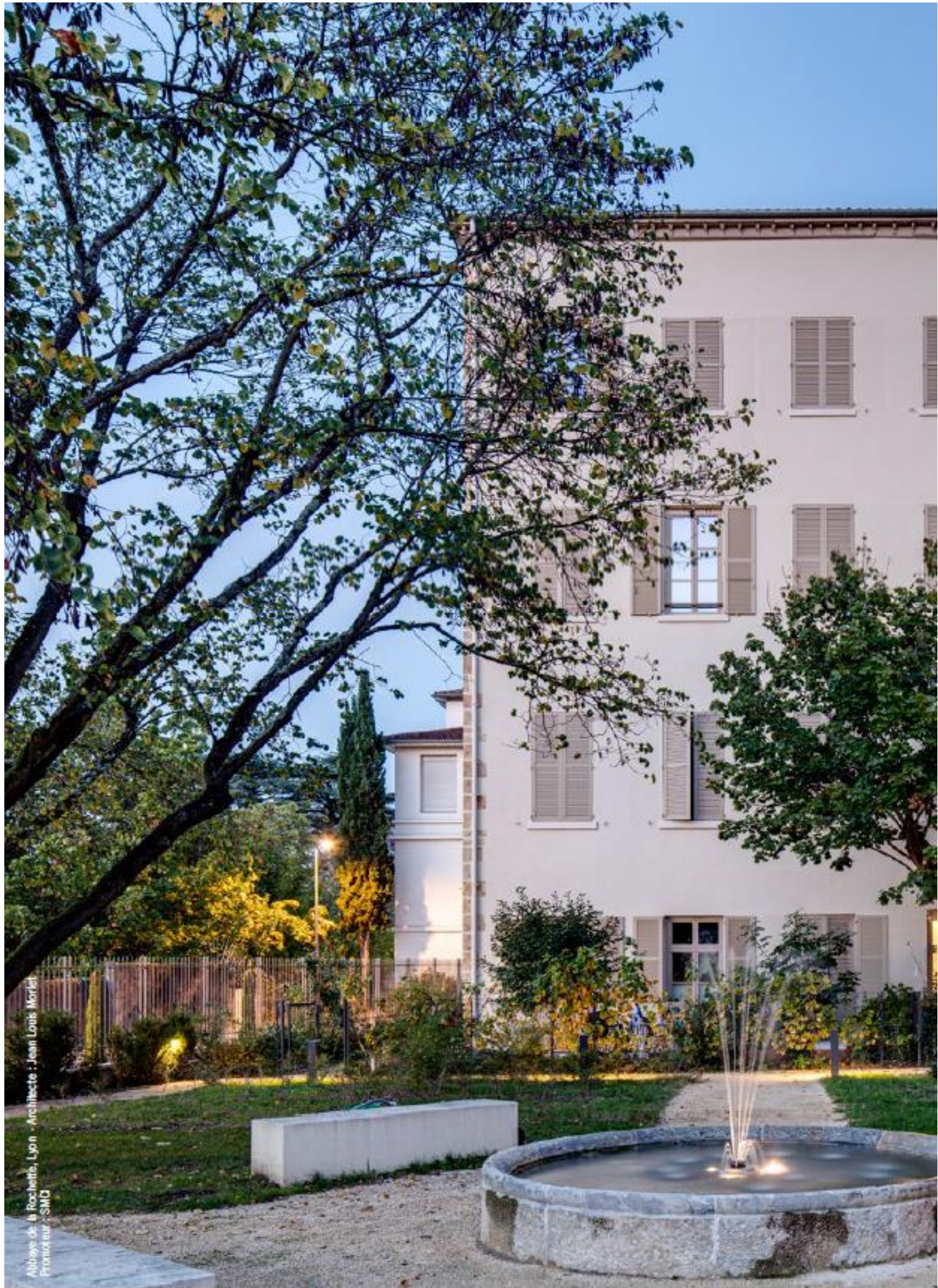
Abbaye de la Rochette, Lyon - Architecte : Jean Louis Morlet Promoteur : SMO